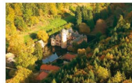
Wasserschloss bei Mespelbrunn

Telefon: 0 93 71-9 78 80 www.gasthof-adler.de