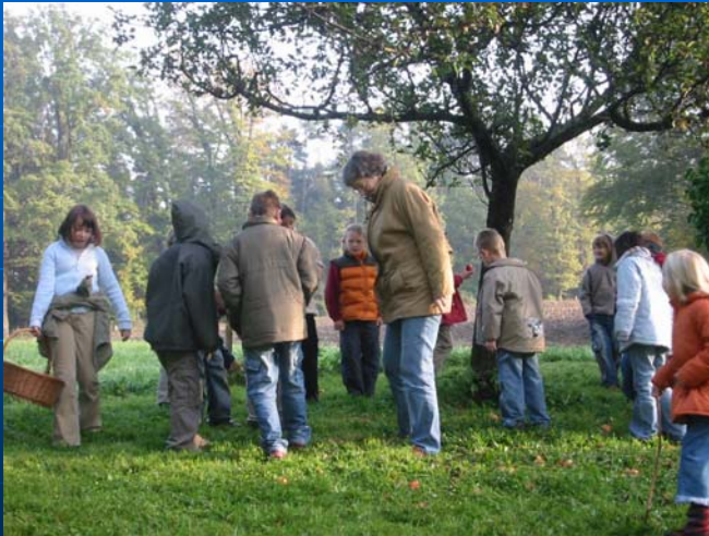
Jenaplanschule - Volksschule Kalkleiten Susanne Moosbrugger