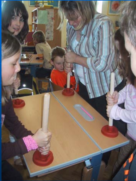
Jenaplanschule - Volksschule Kalkleiten Susanne Moosbrugger