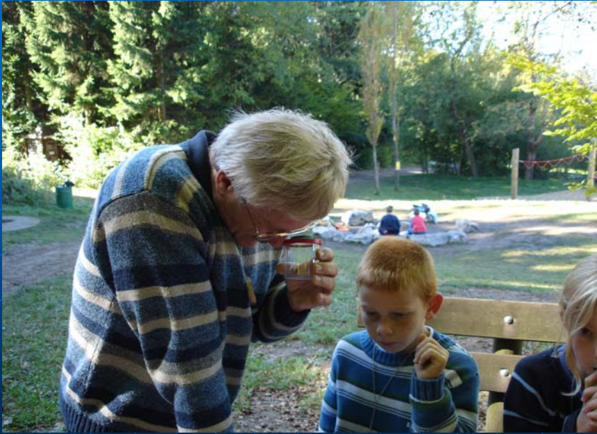
Jenaplanschule - Volksschule Kalkleiten Susanne Moosbrugger