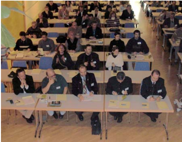
140 TeilnehmerInnen aus sechs Nationen