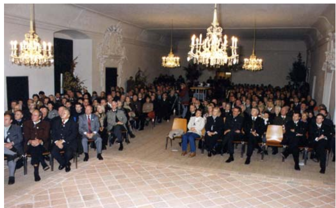
Festgaste im Dormitorium des ehem. Stiftes Neuberg an der Murz