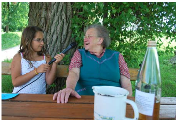
Sammeln von Obstgeschichten

Schützen: Mit den beiden Volksschulen und dem Gymnasium Dachsberg wurden Streuobstwiesenprojekte realisiert, außerdem standen 2011 der Workshop „Sensenmähen für den Hausgebrauch“, die Fortsetzung der Flusskrebs-Untersuchung und die Pflege von Kopfweiden auf dem Programm.