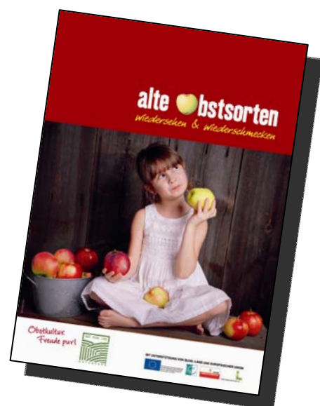
Hilfe bei der Suche nach dem Traumbaum

Kreative Ideen: die Traumbaumaktion, ermöglicht es, aus einer Datenbank seinen Traumbaum aus rund 100 verschiedenen Sorten nach eigenen Kriterien auszuwählen und als kleines Bäumchen zu bestellen. Im Rahmen des Projektes „Alte Obstsorten wiedersehen & wiedererschmecken“ wurde auch der Obstlehrgarten St. Marienkirchen beschildert.