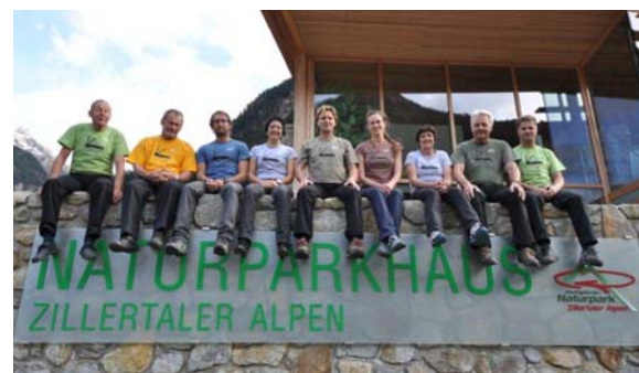
Naturführer/innen des Naturparks

Im Sommer organisiert der Naturpark das gesamte Sommerprogramm der Region mit 250 geführten naturkundlichen Wanderungen. Zusätzlich werden Fachvorträge und Fachexkursionen zu Schwerpunktthemen angeboten. Außerdem bietet der Naturpark die „Trekking-Pauschale Berliner Höhenweg“ an. Auf dieser Tour kann in sieben Tagen der gesamte Naturpark erwandert werden.