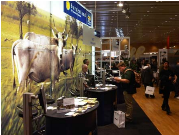
Messestand bei der Photo+Adventure in Wien

In Kooperation mit Burgenland Tourismus präsentierten sich die Bgld. Naturparke auf zwei Messen: Im September auf der Tour Natur in Düsseldorf und im November auf der Photo+Adventure in Wien. Beide Messen waren sehr gut besucht und die Angebote der Naturparke stießen auf reges Interesse.