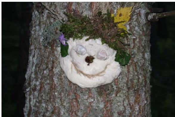
Der „Zeitgeist“, gefunden bei einem LERN-Gang

Mit dem laufenden Projektjahr 2011/12 wurde innerhalb der St:WUK eine Neustrukturierung umgesetzt. Aus organisatorischen Gründen wurden auf Wunsch des AMS Steiermark zwei Großbereiche geschaffen. Das Projekt „Arbeitsplätze für steirische Naturparkregionen“ bleibt weiter ein eigenständiges Projekt und findet sich nun im Projektbereich „Natur und Umwelt“ wieder.