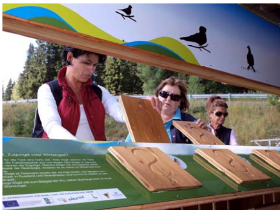
Interaktive Stationen bei der Aichingerhütte

In der Aichingerhütte gibt es zahlreiche interaktive Stationen zu den einzelnen Naturpark Themen. Sowohl eine Gesamtübersicht über den Naturpark Dobratsch als auch spielerische Elemente für Kinder, aber auch künstlerisch gestaltete Bereiche wurden geschaffen.