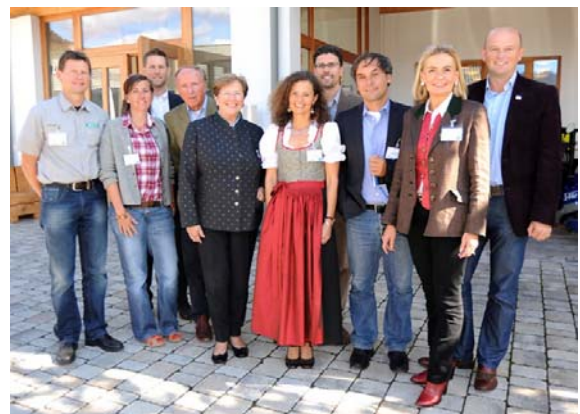
Teilnehmer/innen der 2. Konferenz der Arge „Naturerlebnis Kärnten“

Die Arge „Naturerlebnis“ soll aber nicht nur als „Stammtisch“ für Schutzgebietsverwaltung und Touristiker dienen. Wichtiges Ziel ist es, hochqualitative, buchbare Angebote für die Gäste zu entwickeln. Dabei soll die regionale Wertschöpfung im Vordergrund stehen. Nicht der Billigtourismus ist das Ziel, sondern eine guter Preis für einen unvergesslichen Urlaub, von der Kulinarik mit heimischen Produkten, über die Mobilität bis zum Natur-Ranger, die Wertschöpfung in den Regionen soll erhöht werden.