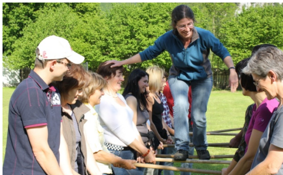
„Der Wanderer“

Naturinteressierte Personen, die durch erlebnisorientierte Naturvermittlung das Verständnis für Natur, ökologische Zusammenhänge, Natur- und Landschaftsräume stärken wollen, bietet der Kurs das Grundlagenwissen sowie viele Möglichkeiten für praktisches Tun.