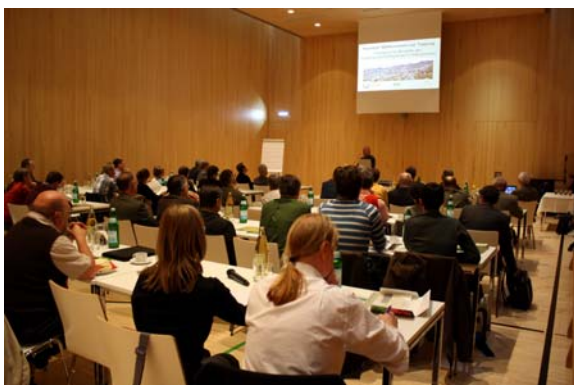
Rund 60 Teilnehmer/innen kamen zur Tagung nach Altmünster

Um diesen Fragen auf den Grund zu gehen, lud der Verband der Naturparke Österreichs in Kooperation mit dem Land Oberösterreich am 20. Oktober 2011 zur mit 60 internationalen Teilnehmer/innen gut besuchten Naturparkbürgermeister-Tagung „Erfolgreiche Modelle der Kulturlandschaftspflege in Naturparks“. In Altmünster diskutierten Expert/innen aus dem In- und Ausland über erfolgreich durchgeführte Projekte und zeigten Möglichkeiten der Zusammenarbeit und Finanzierung auf, wie die Kulturlandschaft der Naturparke auch in Zukunft erhalten bleiben kann.