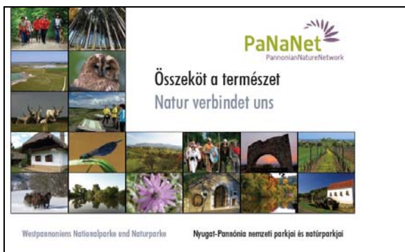
PaNaNet Bildband „Natur verbindet uns“

Unter dem Motto „Natur verbindet uns“ wurde im Rahmen des PaNaNet-Projektes ein prachtvoller, zweisprachiger Bildband erstellt und der Öffentlichkeit präsentiert. Die Naturschönheiten des Burgenlandes und Westungarns werden durch zahlreiche, atemberaubende Fotos, Grafiken, Karten und Texte dargestellt. Besonders herausgestrichen werden dabei die unglaubliche Vielfalt an unterschiedlichen Landschaftselementen auf geographisch relativ kleinem Raum und die Besonderheiten der einzelnen Schutzgebiete. Diese Besonderheiten sind einerseits Raritäten aus Fauna und Flora, andererseits aber auch das breite Spektrum an zielgruppenorientierten Naturerlebnisangeboten, welches den Besucher/innen der Natur- und Nationalparke geboten wird. Vor allem soll das Buch das Interesse und die Neugierde für die PaNaNet Schutzgebiete wecken und den Leser dazu einladen, sich selber auf Erkundungstour durch die PaNaNet Region zu begeben.