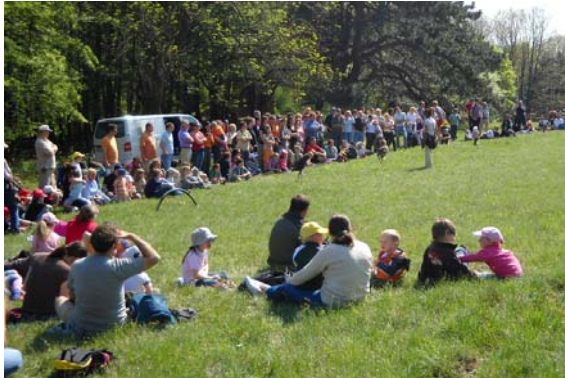
Naturparkfest mit Greifvogelschau im Naturpark Sparbach

Deutschland, Luxemburg und der Schweiz unterzeichnet. Die Vertreter/innen dieser Länder werden 2012 auch zu den Feierlichkeiten in Österreich erwartet.