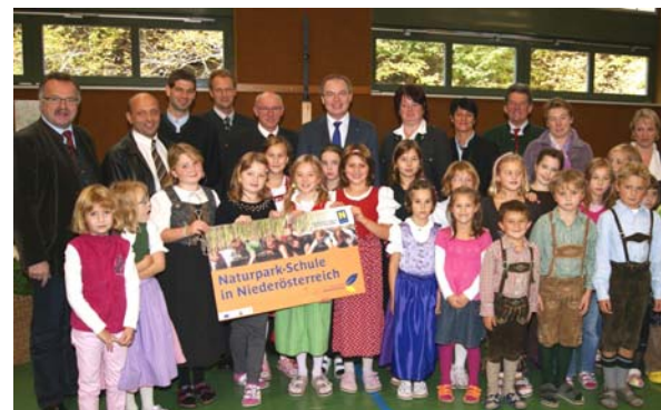
Schüler/innen und Lehrer/innen der zukünftigen Naturpark-Schule im Naturpark Ötscher Tormäuer