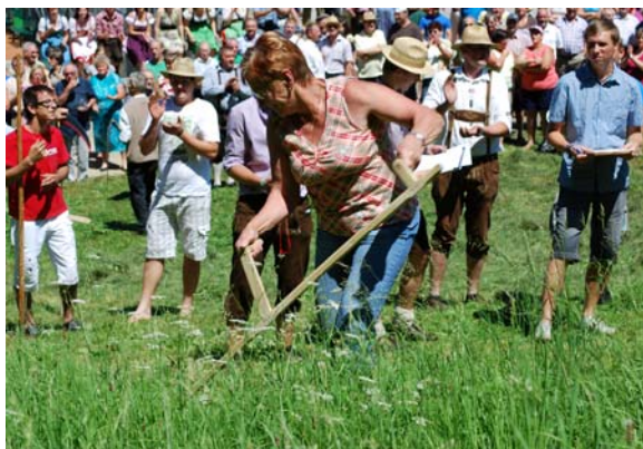
Sensenmähen in St. Thomas am Blasenstein

Dass die gemeinsame Erledigung von Arbeit oft entscheidend ist für die Entwicklung eines „Wir-Gefühls“ haben jene Senioren und Jugendlichen erlebt, die sich im Frühsommer 2011 an einem Sensenmähkurs in St. Thomas beteiligten sowie jene 600 Besucher/innen, die im Juli das Mähfest mit einem Sensenmähwettbewerb und eine Naturexkursion besuchten.