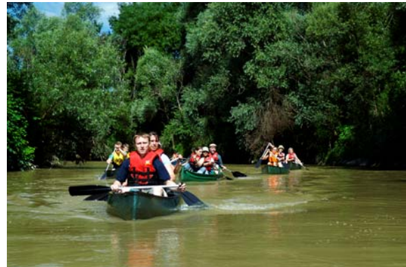
Kanufahrt auf der Raab

Der Startschuss erfolgte in der St. Martins Therme & Lodge, die selbst höchst erfolgreich ganzjährig geführte „Safaris“ anbietet. Neun über das ganze Land verteilte „Base-Camps“ waren Treff- und Ausgangspunkte für die 48 Naturerlebnisse. Großer Hit: Die Kanutouren, die allesamt ausgebucht waren und vor allem beim jungen Publikum regen Zuspruch fanden.