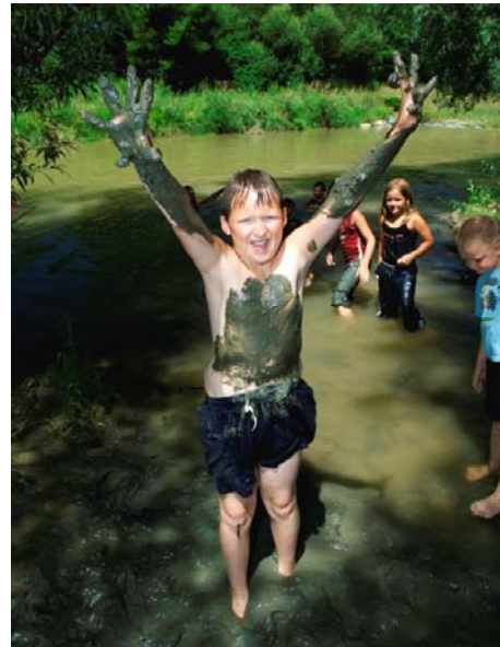
Natur erleben – Natur begreifen

Berücksichtigung der Studienergebnisse zu verstärken und österreichweit koordinierte Marketingaktivitäten umzusetzen.