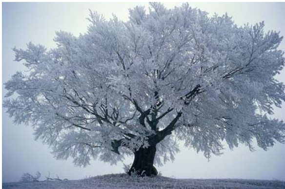
Vom Raureif überzogene „Frostbuche“ im Naturpark Pöllauer Tal

Keine Sorge mit der Schneelage machen sich die steirischen Naturparke. Viele Aktivitäten des neuen Winterprogramms sind unabhängig von Schnee und Pisten.