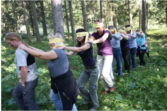
„Blinde Karawane“ im Naturpark Mürzer Oberland