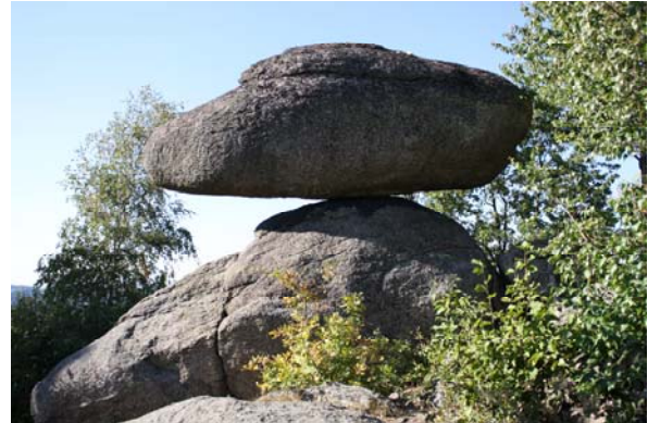
Der Schwammerling – das Wahrzeichen des Naturparks Mühlviertel

den Naturpark Mühlviertel ein. Bei strahlendem Herbstwetter wurden die Gäste durch das Tannermoor geführt und besuchten die Sehenswürdigkeiten des Naturparks, wie z.B. den Schwammerling und den Großdöllnerhof.