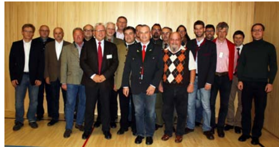
Mitglieder des VNÖ Präsidiums, Beiräte, Schiedsgericht und Rechnungsprüfer

Das Präsidium des VNÖ freut sich schon auf eine gute Zusammenarbeit mit den Kooperationspartnern, Naturparks und Sponsoren. (Das genaue Wahlergebnis kann auf der Homepage des VNÖ nachgelesen werden.)