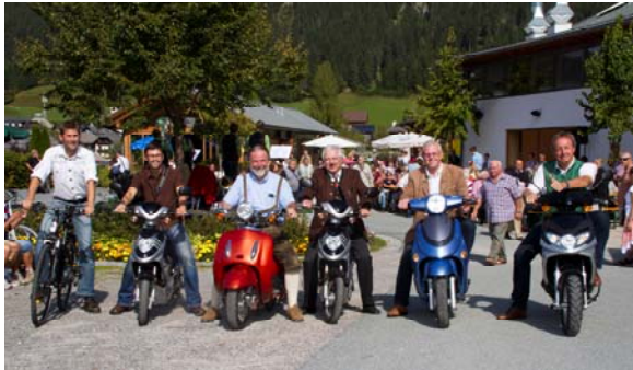
Naturpark Weissensee Vertreter beim Testen der Elektrofahrzeuge

führt. Der Naturpark Bus kommt bei Tagesgästen wie bei Urlaubern sehr gut an. Er führt vom Parkplatz am Anfang des Weissensees in Praditz bis zum Zentrum und nach Neusach und Naggl. In den Sommermonaten Juli und August konnten 27.152 Fahrgäste gezählt werden. Gleichzeitig war eine spürbare Verkehrs- und Lärmmentlastung in Ortszentrum wahrnehmbar.