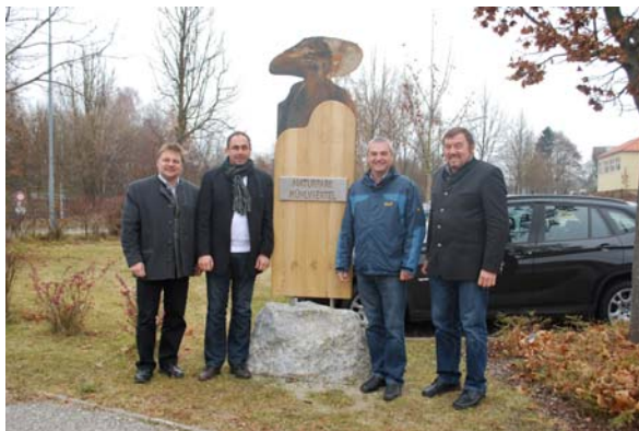
Herzliches Willkommen im Naturpark

Den Naturparkverantwortlichen ist es ein Anliegen, die Modellregion für eine nachhaltige Entwicklung deutlich sichtbar zu machen. So hat im Oktober dieses Jahres jeder Ort an einer zentralen Stelle ein Willkommenobjekt erhalten, das auf den Naturpark deutlich hinweist.