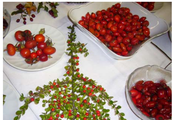
Workshop Wildobst & Pilze

Das Projekt „Naturpark-Spezialitäten“ neigt sich dem Ende zu. Weiterbildungsseminare können in den teilnehmenden Naturparks noch bis 31. März 2012 durchgeführt werden. Daher bitte möglichst bald beim LFI Steiermark melden, wenn der Wunsch nach einem Seminar besteht.