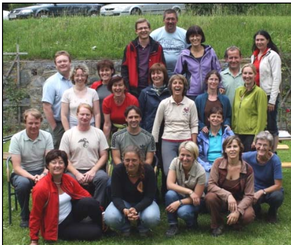
Die Teilnehmer/innen des Jahrganges 2011

In fünf Modulen in der Steiermark und dem Burgenland lernten sie, wie Natur interessant und erlebnisreich vermittelt werden kann und wie man aus einer Führung ein Erlebnis für alle Sinne macht. Die Abschlussarbeiten und Präsentationen spiegelten die ganze Bandbreite der Persönlichkeiten der Teilnehmer/innen wider. Führungen mit Ponys, eine Waldolympiade, das Blumenreich Straßenrand, der Lebensraum Ökohof und die kulinarische Wiese wurden vorgestellt. Außerdem fanden Abstecher in die Kinesiologie und Astrologie statt.