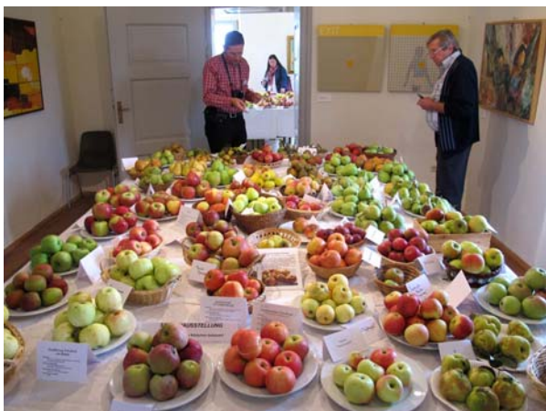
Hunderte Obstsorten wurden in Schloss Tabor präsentiert

Neben der geballten Information besonders beeindruckend: die Obstsortenausstellung mit ca. 350 Sorten, die ganze Zimmerfluchten des Schlosses Tabor füllte und herrlich duftete.