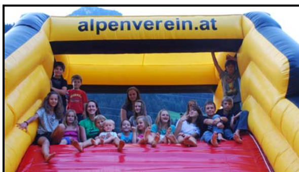
Junge Gäste beim Naturparkfest

Der Naturpark ist zudem im Bereich Bildung aktiv und versucht die Kinder der Region als Multiplikatoren für das Schutzgebiet zu sensibilisieren. Drei Schulen in der Naturparkregion haben den Naturpark als Schulschwerpunkt und damit in ihren Schulalltag aufgenommen.