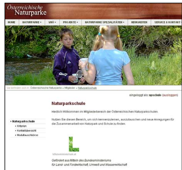
Startseite des Member-Bereiches der Naturpark-Schulen auf der Homepage des VNÖ

Eine Darstellung der Natur- und Landschaftsführer/innen in den Regionen mit ihren Programmen wurde in der Rubrik „Expertenkatalog“ erstellt, die laufend erweitert werden wird. Außerdem finden sich im Member-Bereich Kontaktdaten für Institutionen im Fortbildungsbereich.