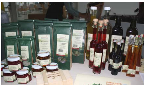
Die breite Palette der Naturpark-Spezialitäten wurde bei den Artenschutztagen präsentiert und verkostet

Durch die Bewirtschaftung der Bauern und Bäuerinnen werden Kulturlandschaften in den Naturparken erhalten, die sonst z.B. durch Verwaldung verschwinden würden. Außerdem sind diese Kulturlandschaften Lebensräume für viele Tier- und Pflanzenarten. Steinkäuze und Fledermäuse finden Schlafplätze in alten Bäumen auf Streuobstwiesen. In den alpinen Naturparken halten Schafe und Ziegen steile Flächen offen, auf denen Schmetterlinge, Wildbienen und andere Insekten leben. Aus diesen Kulturlandschaften werden die Produkte gewonnen, die als Naturpark-Spezialitäten bekannt sind.