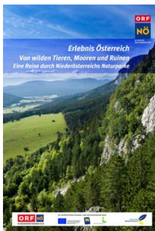
Die Niederösterreichischen Naturparke auf DVD

22 Naturparke zeigen Niederösterreichs Schönheiten der Natur – sechs davon portraitiert eine filmische Reise des ORF Landesstudios Niederösterreich. Uralte Rotbuchen, verspielte Fischotter, fleischfressende Pflanzen, atemberaubende Landschaften: die Schätze der Naturparke sind vielfältig von der Hohen Wand im alpinen Bereich bis zur Weinviertler Steppe der Leiser Berge. Egal, ob künstliche Ruinen im Naturpark Sparbach, dunkle Waldviertler Moore, Luchse im Naturpark Buchenberg oder die wildromantische Landschaft des riesigen Naturparks Ötscher-Tormäuer.