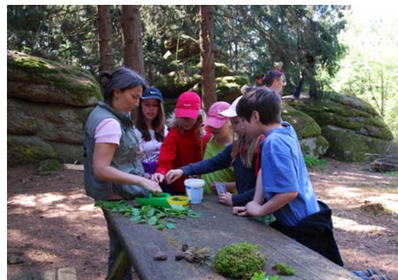
Kinderferienprogramm im Naturpark

Naturvermittlungsangebote erfreuten sich 2011 großer Beliebtheit. Zu den 105 Naturparkführungen kamen mehr als 1800 Personen, die großteils aus dem Raum Linz, aber auch aus dem Salzkammergut und dem Innviertel anreisen. Einer der Höhepunkte im Veranstaltungsjahr 2011 war der Walderlebnistag für Familien mit rund 300 Teilnehmer/innen. Die Nachfrage motivierte acht Personen für die Ausbildung zum/r Natur- und Landschaftsführer/in, aber auch drei Weiterbildungstage für die versierten Naturparkführer/innen der ersten Generation wurden mit Begeisterung angenommen. Glücklicherweise waren auch jene Kinder, die im Naturpark an einem speziellen Kinderferienprogramm teilnehmen konnten.