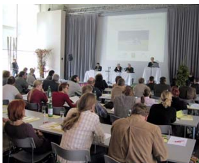
102 TagungsteilnehmerInnen aus Österreich, Deutschland und der Schweiz

102 TeilnehmerInnen aus Österreich, Deutschland und der Schweiz kamen ins Schlosscenter, um Neues über aktuelle Trends in der Angebotsgestaltung, erfolgreiche Beispiele aus Naturparksen sowie über Naturpark-relevante rechtliche Fragen im Zusammenhang mit der Bereitstellung von Erholungseinrichtungen zu hören und zu diskutieren. So beschäftigte sich ein Beitrag mit der Frage, wie sich die Landschaft auf das physiologische und psychische Wohlbefinden des Menschen auswirkt – eine wichtige Wissensgrundlage für Entscheidungen rund um die Landschaftsgestaltung in den Naturparksen. An den Beispielen der Länder Niederösterreich und der Steiermark wurde gezeigt, wie wichtig und gewinnbringend für beide Seiten eine gute Zusammenarbeit zwischen Naturschutz und Tourismus ist.