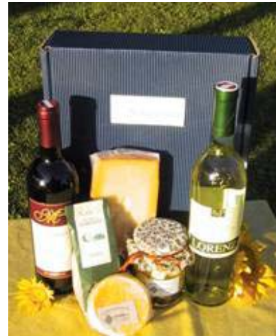
Naturpark-Variation von Käse und Wein

Bestellungen werden bis inklusive Freitag, 26. November entgegen genommen! Bestellung beim VNÖ (siehe Impressum oder unter: http://www.naturparke.at/index2.html?aktion/home.html