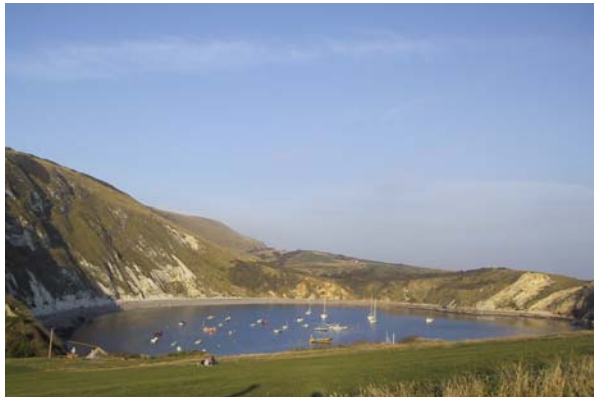
Lulworth Cove (World Heritage Site)

Die diesjährige Fachexkursion des VNÖ führte uns nach England. Die 20 TeilnehmerInnen aus fünf Bundesländern, welche in verschiedenen Bereichen für die Naturparke tätig sind, wollten sich das System in England zu Gemüte führen.