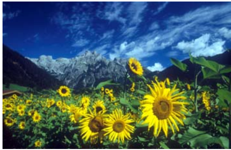
Sonnenblumenfeld in Werfenweng