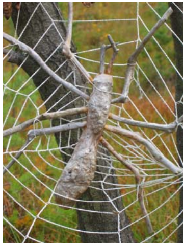
Eines der Siegerprojekte aus dem Naturpark Heidenreichsteiner Moor

Am 22. November 2004 wird Landesrat Emil Schabl im Landhaus St. Pölten anlässlich des Abschlusses des LandArt-Projektes der NÖ Naturparke Siegerprojekte auszeichnen und eine Ausstellung dazu eröffnen.