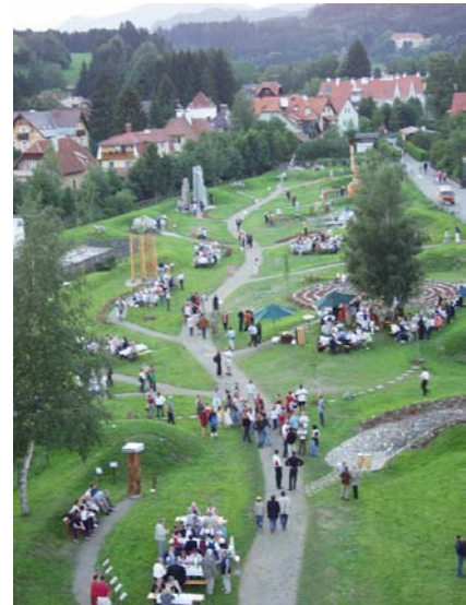
Eröffnung des NaturLeseParks

Schon im nächsten Frühjahr wartet der NaturLesePark mit einem neuen Anziehungspunkt auf. Über 5.000 Frühjahrsblüher wurden noch diesen Herbst gepflanzt. Somit werden Krokus, Narzisse, Blaustern & Co den Park in ein einziges Blütenmeer verwandeln. Aber auch im winterlichen Kleid wir der NaturLesePark seinen besonderen Zauber versprühen.